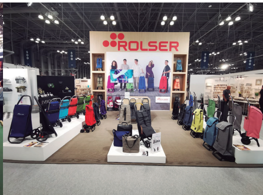
NY NOW New York